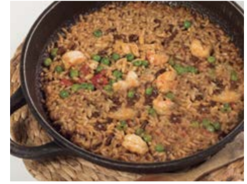
Arròs al carbó 15,25 / pers. Paella senyoret a la brasa