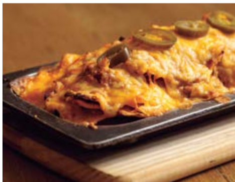
"Nachos" a la brasa 10,50 Amb carn picada, tomàquet, "jalapeños" i formatge fos