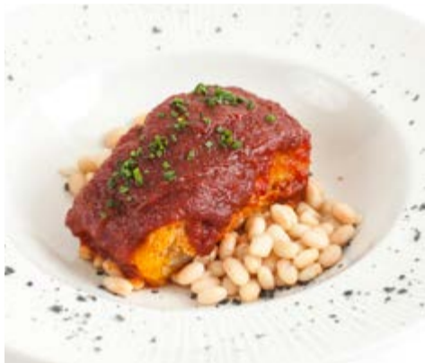
Morro de bacallà a la llauna 19,75 Saltejat amb all, bitxo i tomàquet