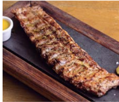
Costellam de porc 19,90 Amb dues coccions, baixa temperatura 20 h a 75°C i finalitzat a 400°C al Jospers®