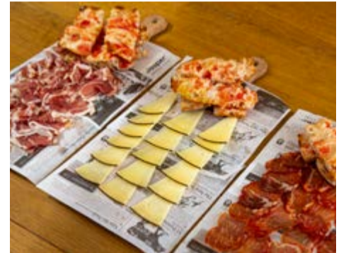
Mitges racions Pernil ibèric, llom ibèric i formatge d'ovella curat