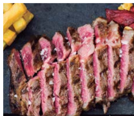
Llom de Wagyu 14,00 / 100g Llom de Wagyu sense os