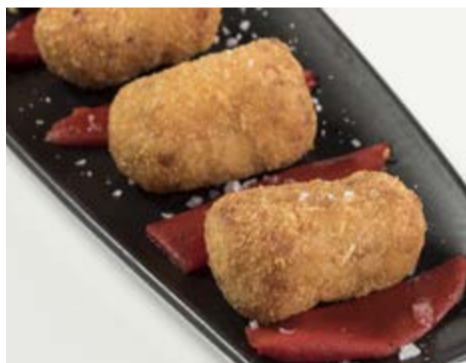
Croquetes casolanes 8,85 Les nostres croquetes casolanes