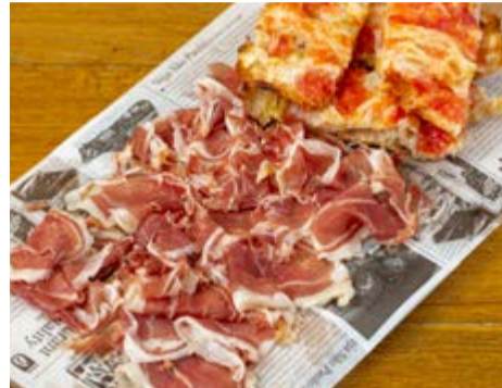
Ració pernil ibèric de gla 21,95 *Les nostres racions se serveixen amb pa torrat amb tomàquet