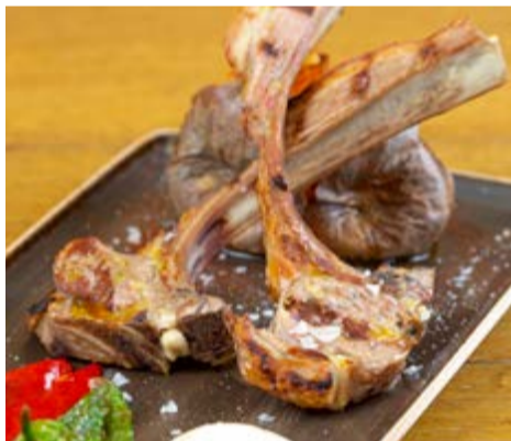
Costelles de xai 7,50 / u. En aquesta casa només es ven costella de pal. Quantes en vol?