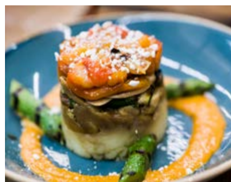
Timbal de verdures 9,75 A la brasa amb formatge de cabra (o sense)