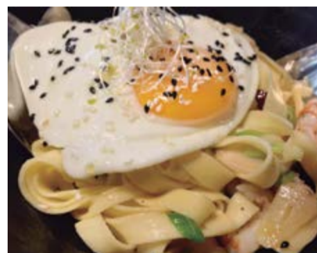
Tagliatelle all'aglio 13,50 Amb llagostins, all, bitxo i coronats amb un ou ferrat