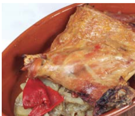
¼ lletó a la brasa 62,00 Fet molt lentament