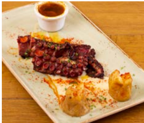
Pop a la brasa 22,25 Sobre parmentier trufat de patata i pebre vermell de la Vera