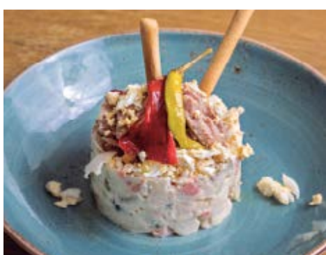
Amanida russa 7,75 Amb maionesa, pèsols, olives, tonyina i ou dur